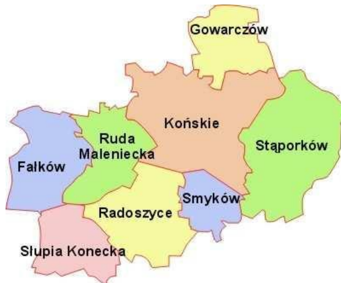
Rys. 1. Położenie gminy Smyków w powiecie koneckim.

Gmina Smyków położona jest w południowej części powiatu koneckiego i w północno-zachodniej części województwa świętokrzyskiego. Od północy graniczy z gminą Końskie, od wschodu z gminą Stąporków, od południa z gminą Mniów, a od zachodu z gminą Radoszyce.