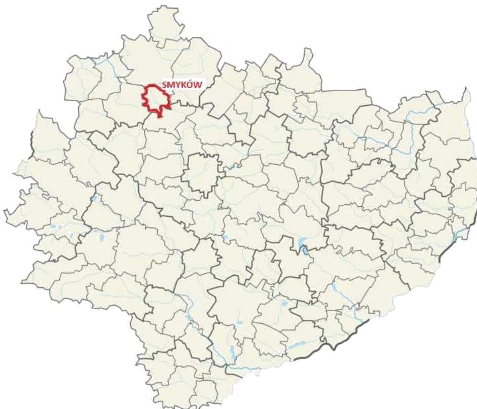
Rys. 2. Położenie gminy Smyków w województwie świętokrzyskim.

Gmina licząca ok. 3,8 tys. (stan na dzień 31.12.2011 rok) mieszkańców i obejmująca obszar 62 km 2 należy w województwie świętokrzyskim do grupy gmin małych, z dominującą funkcją drobno obszarowego rolnictwa indywidualnego, o niższej od przeciętnej wojewódzkiej wartości produkcyjnej gleb i niskiej towarowości oraz z dość wyraźnym przerostem zatrudnienia w rolnictwie w stosunku do średniej wojewódzkiej, wynikającym w znacznej mierze z dwuzawodowości większości mieszkańców.